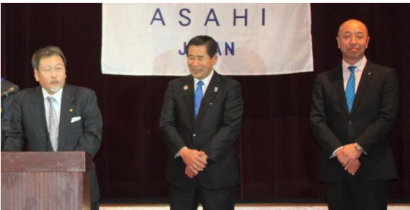
次年度 G 補佐・補佐幹事(右)・会長(中央) 紹介