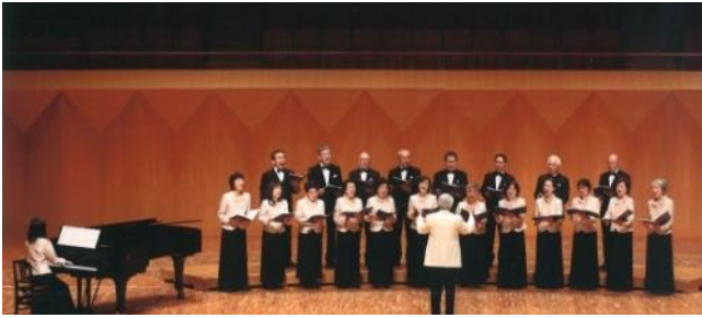
2012年5月横浜 第17回全日本RC合唱祭