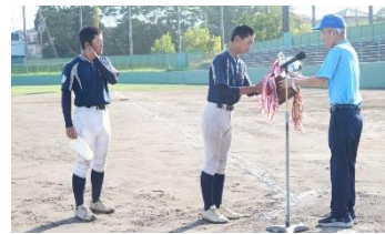
準優勝 打瀬中 (千葉県)