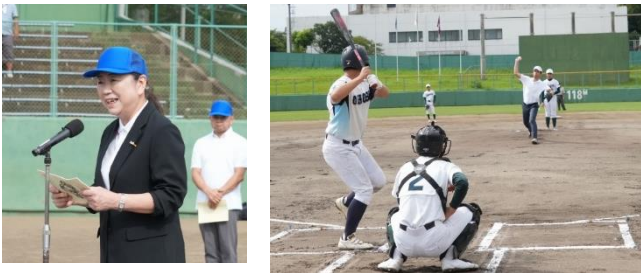
銚子東 RC 森会長挨拶 銚子 RC 淵岡会長始球式