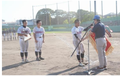
深紅の優勝旗は 茨城オール県南へ メダル授与