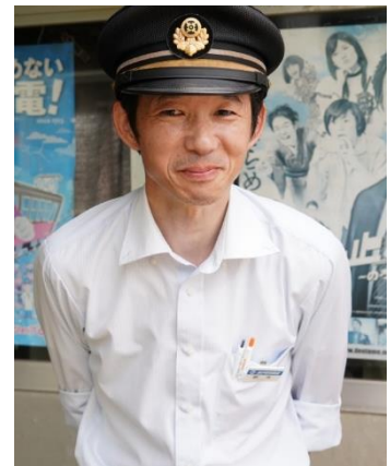
銚子電鉄(株)の皆様 本日はお世話になりました。