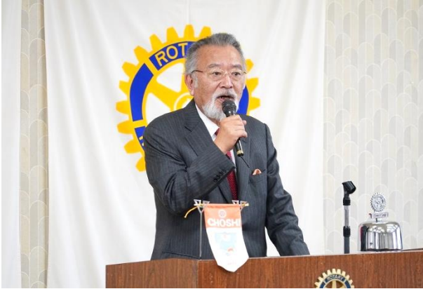
能登半島地震について