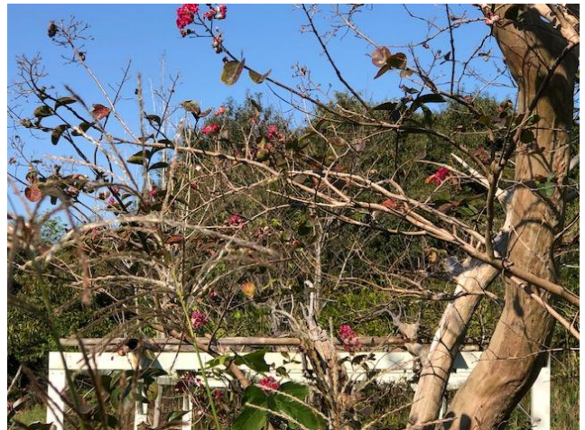
百日紅 まだ花が咲いています。