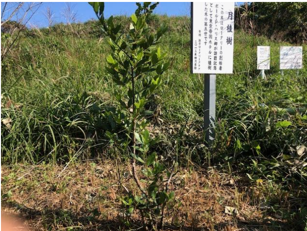
月桂樹の周り草刈りをしました。 (石毛社会奉仕委員長)