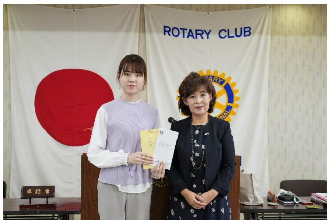
米山奨学生イムさんより 米山梅吉記念館研修旅行のお土産のお菓子をい いただきました。ありがとうございました。