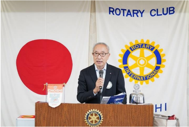
ロータリーの友10月号読みどころ紹介