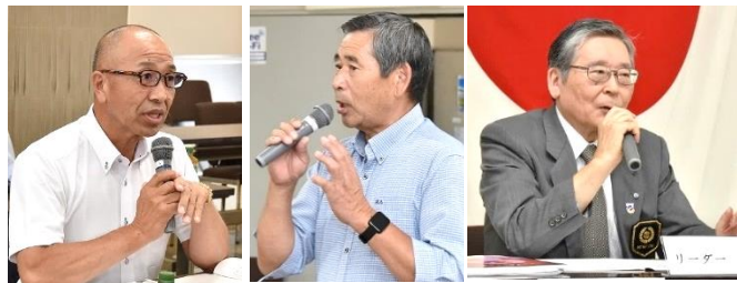
総評 網中ガバナー補佐