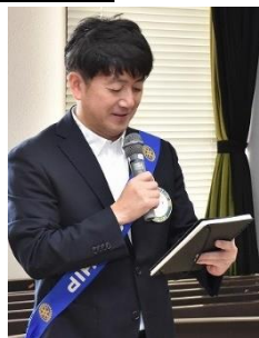
ニコニコ BOX 紹介