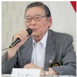
総評 網中ガバナー補佐