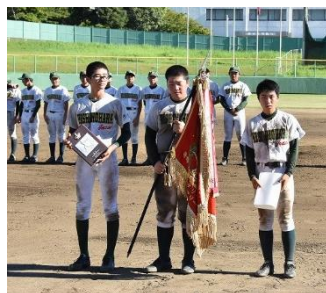
深紅の優勝旗は 印西市立西の原中へ