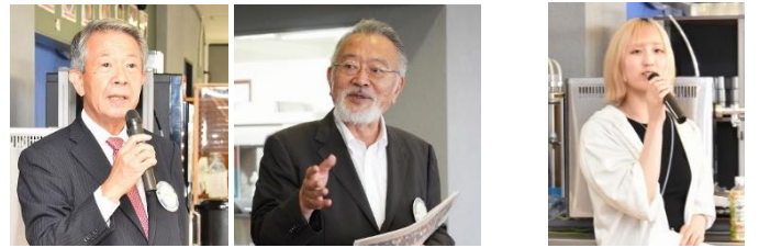
開会挨拶 千葉科学大学学長挨拶 司会: 千葉科学大学 RAC 高瀬銚子 RC 会長