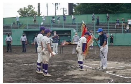
深紅の優勝旗は明大中野八王子中へ