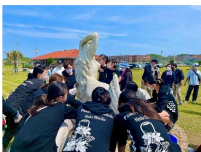
【銚子マリーナの人魚像の清掃活動に 参加する多部田会員 2022.5.5】