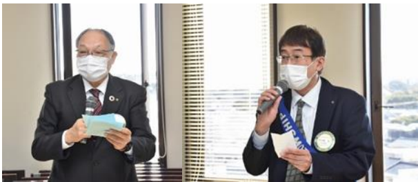
ニコニコ BOX 紹介 飯島会員