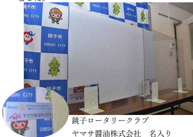
銚子ロータリークラブ ヤマサ醤油株式会社 名入り