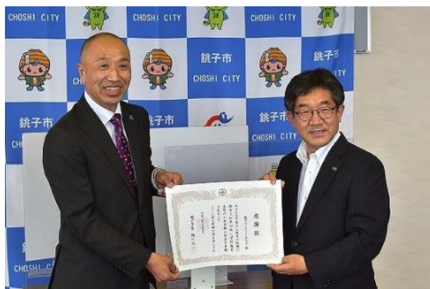
越川市長より感謝状をいただきました。