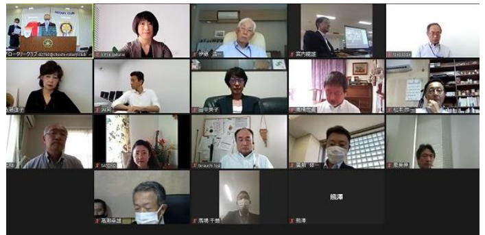
会場参加 9名 オンライン参加 16名