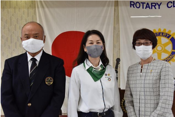
ボーイスカウト銚子第3団 ガールスカウト千葉県第21団