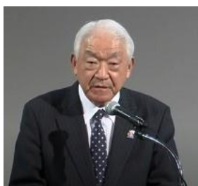
第8グループクラブ紹介 大塚ガバナー補佐