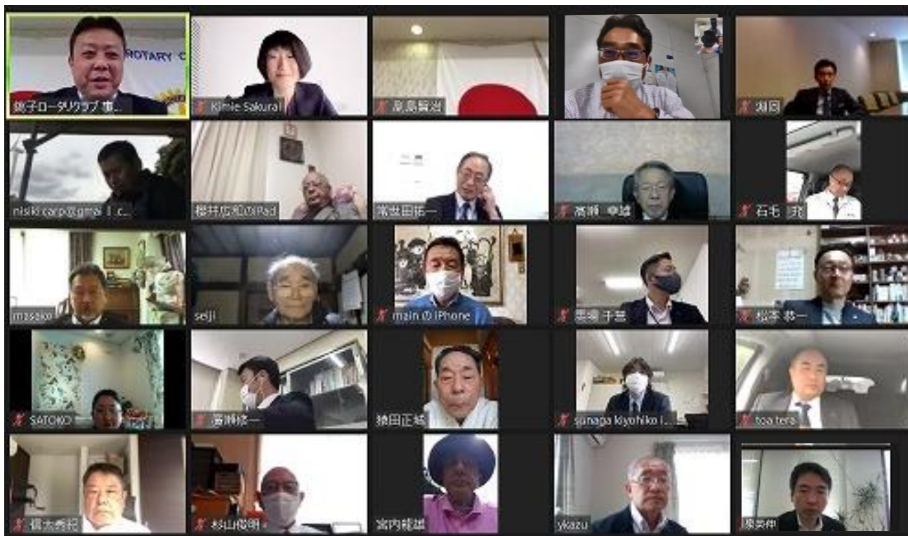
オンライン例会参加 23名