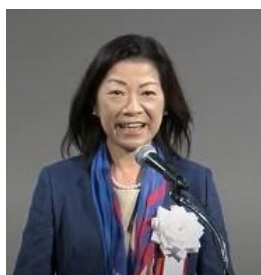
点鐘 漆原ガバナー

14:00 RI会長代理 講話 「RI現状報告およびRI会長代理メッセージ ～ロータリーは無限の機会への招待～」