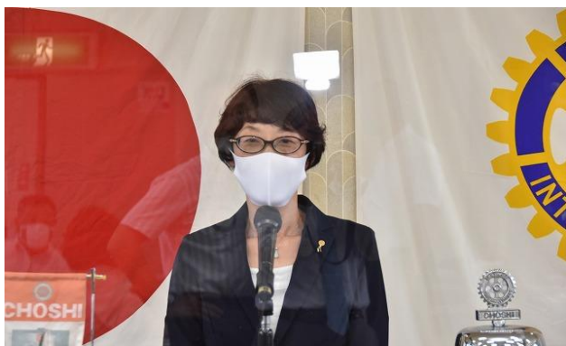
本日から、飛沫感染予防用アクリル板を設置しました。

このように、寄付を通じてできる奉仕、また、自ら活動することによってできる奉仕、どちらも大切なことで、ロータリアンは、その都度状況に応じて、必要とされている奉仕の実践ができたなら、それはとても素晴らしいことだと思います。ロータリアンとして、常にそういう気持ちでいたいものです。