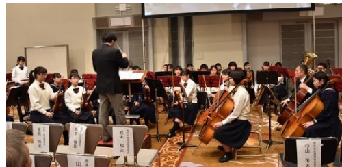
パフォーマンス 成田高等学校・同付属中学校音楽部