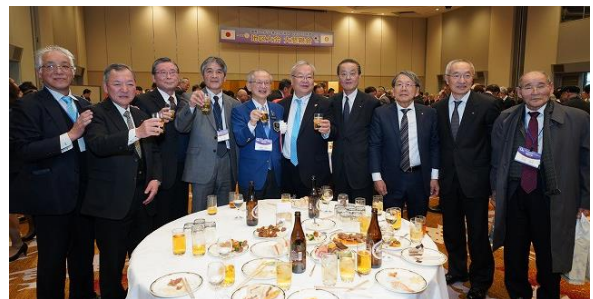
諸岡ガバナーを囲んで